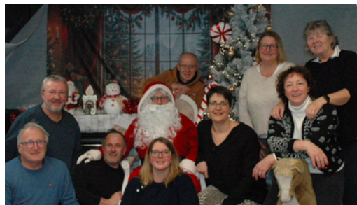
Colis des aînés

Dès le 22 Novembre la soirée Beaujolais a donné le "LA", avec une ambiance western au cœur du Santerre. Comme chaque année une ambiance formidable et un repas qui fait l'unanimité.